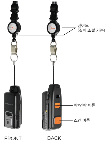
USB-C 슬래드 (랜야드 연결 가능)