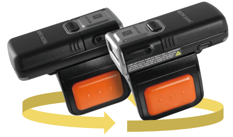
양 손 모두 사용 가능한 링 트리거

관련 문의사항이 있을 시 service@pointmobile.com 을 통해 전달해 주시기 바랍니다.