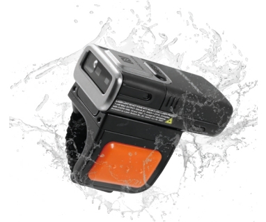
IP65 방수/방진 등급