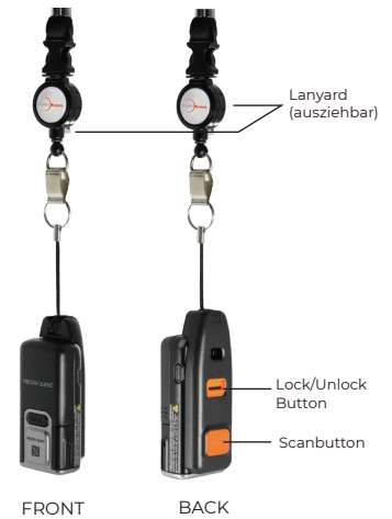
USB-C SLED (MIT LANYARD)

Corporate Headquarters Point Mobile Co., Ltd. pm_sales1@pointmobile.com +82 2 3397 7870